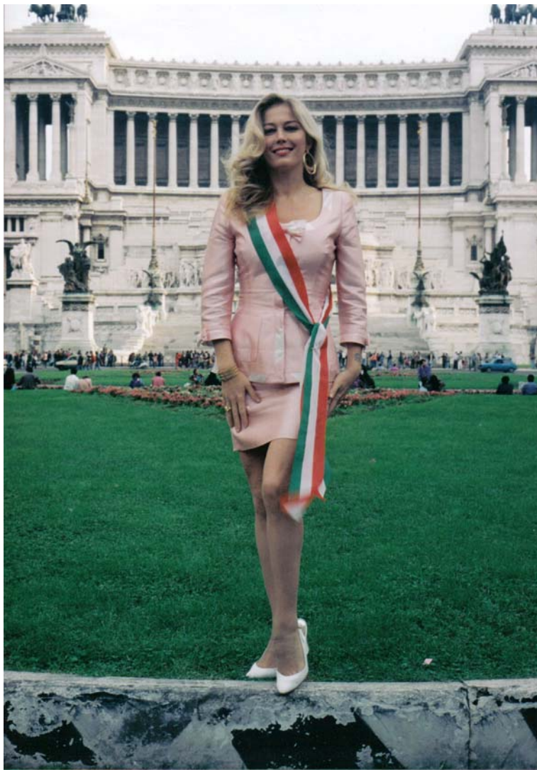
Moana davanti all'Altare della Patria a Roma. Foto per il manifesto alle Elezioni Amministrative, Mauro Biuzzi 1993