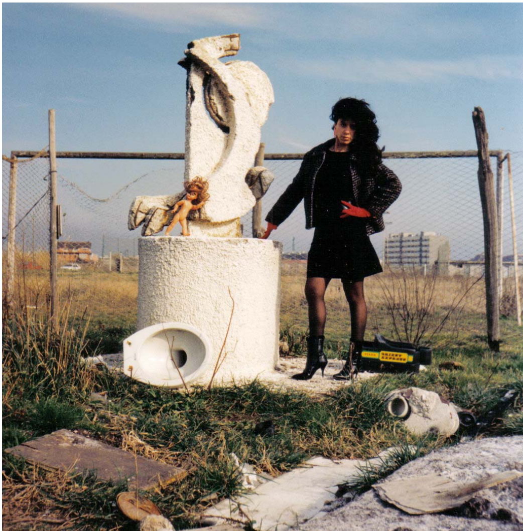
Monumento a Pier Paolo Pasolini in stato di abbandono all'Idroscalo di Roma

Ma si sa che, all'italiano, se gli cadi sull'uccello, diventa una bestia (da Mike Buongiorno a Del Piero, passando per Pasolini e Moana): non Moana ma il Peggio non è mai morto, in questo sfortunato Paese.